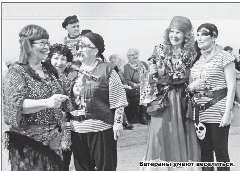
Ветераны умеют веселиться.

Валентина КАЛУГИНА, пресс-центр городского совета ветеранов.