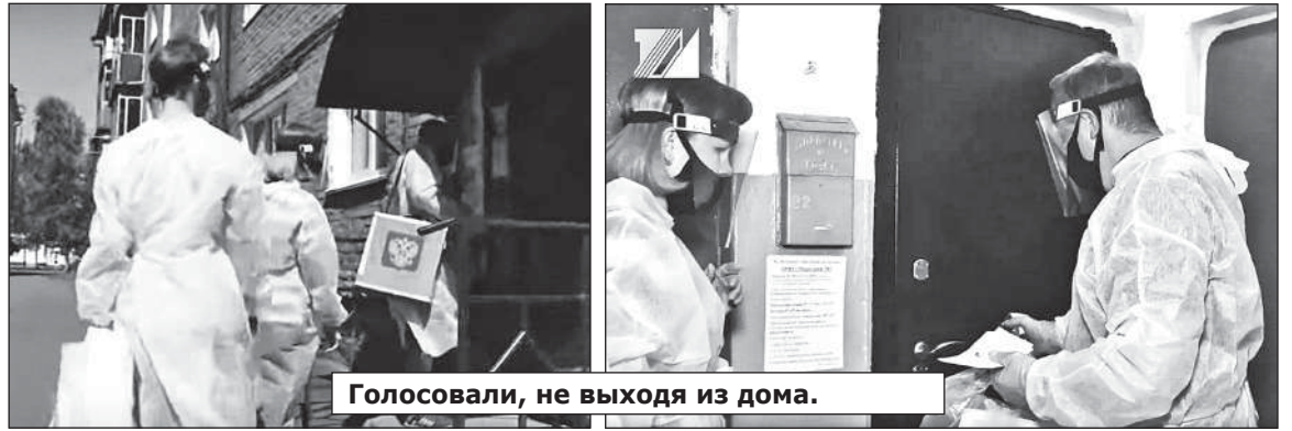
Голосовали, не выходя из дома.