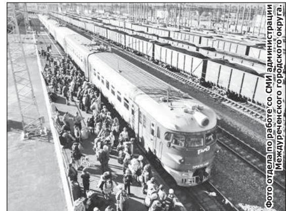
Фото сделано по работе со СМИ администрации Междуреченского городского округа.

Отдел по работе со СМИ администрации Междуреченского городского округа.